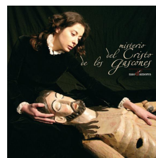
Misterio del Cristo de los Gascones