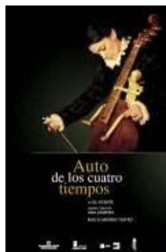
Auto de los Cuatro Tiempos