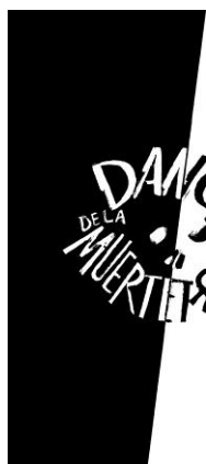
Dança da Morte / Dança de la Muerte