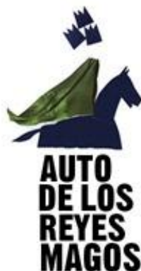
Auto de los Reyes Magos